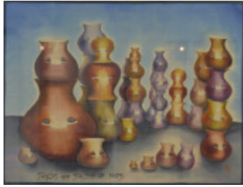
Piles et piles de pots (2002.002)