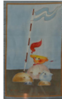
Nous nous demandons si c'est le vent qui agite notre fanion céleste ? (2002.099)